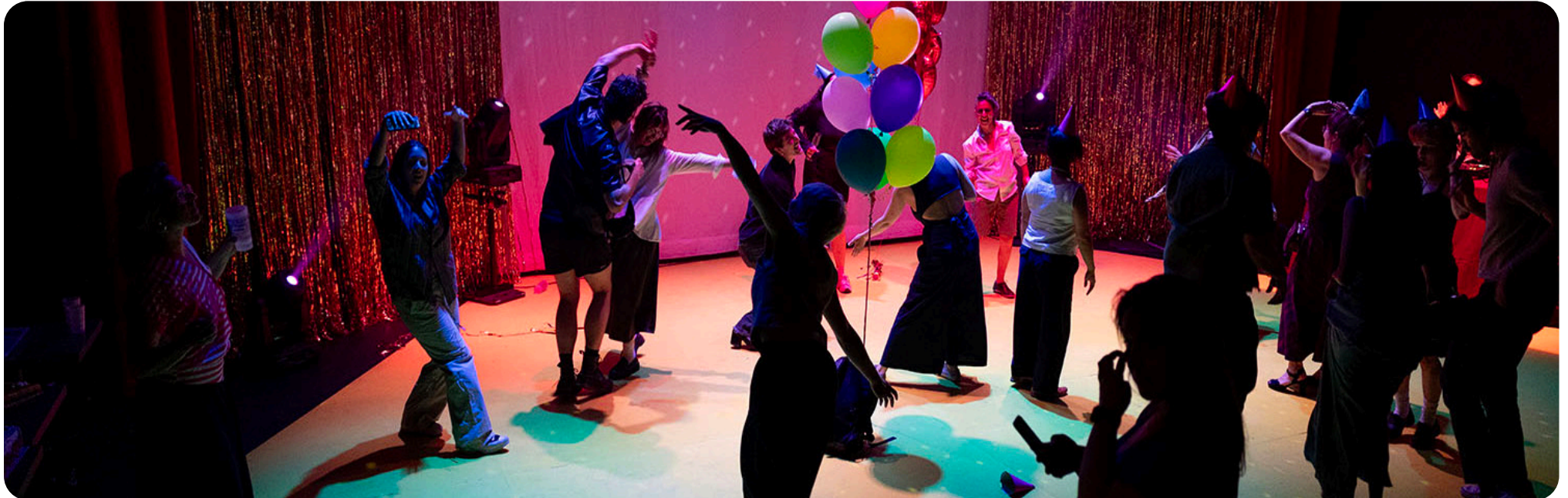
Le dance-floor pendant le Party 35 e anniversaire