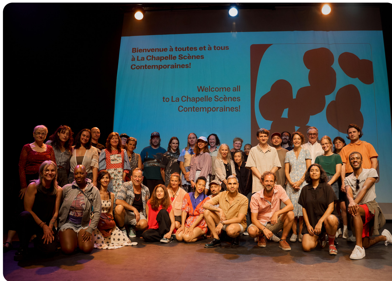
Les artistes et complices de la saison 2024-2025