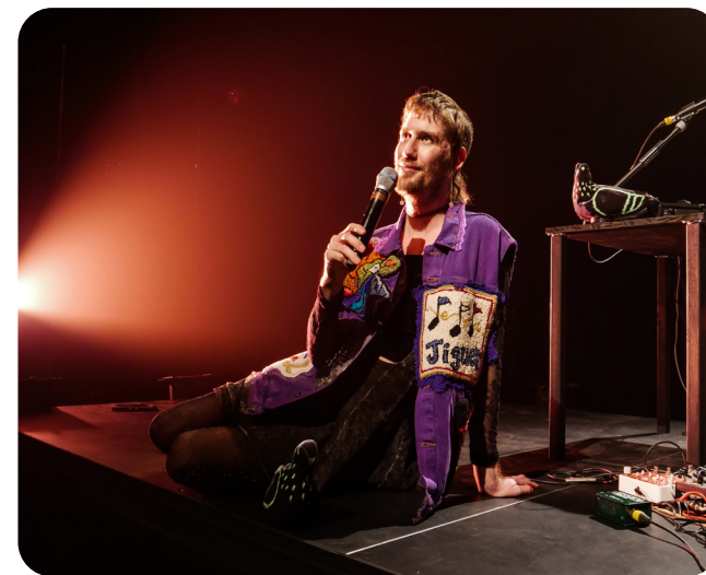
Fano Maddix dans son spectacle Conte bright comme un diamant © Anne-Marie Hivert